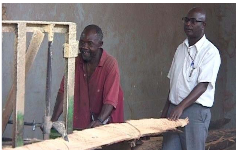
Sodicom à Kolwezi : un bon choix